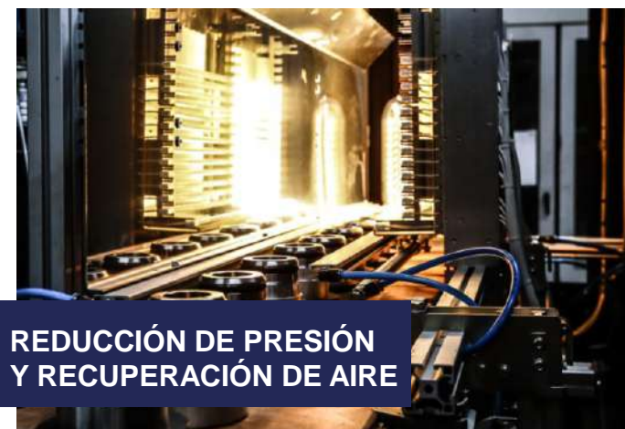
REDUCCIÓN DE PRESIÓN Y RECUPERACIÓN DE AIRE