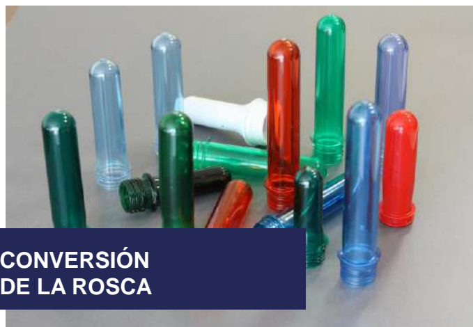
CONVERSIÓN DE LA ROSCA