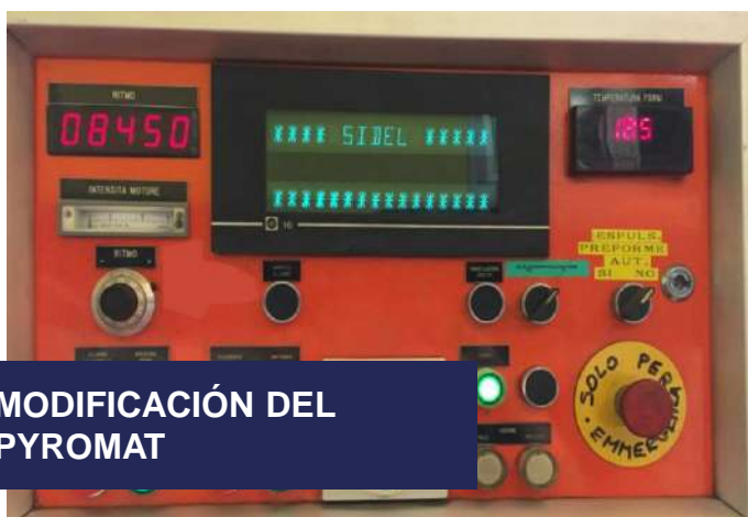
MODIFICACIÓN DEL PYROMAT