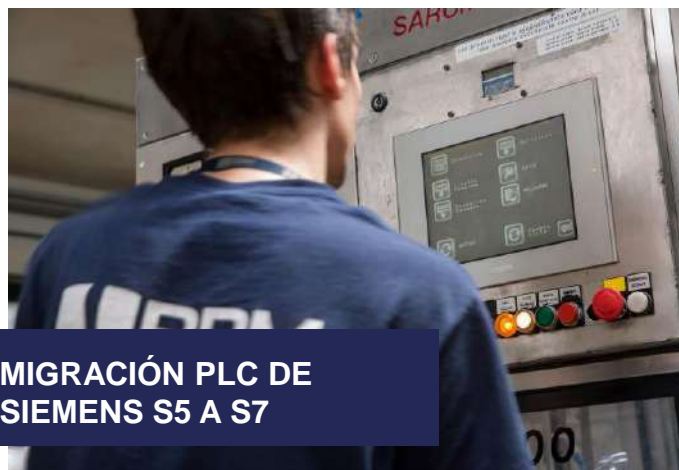
MIGRACIÓN PLC DE SIEMENS S5 A S7